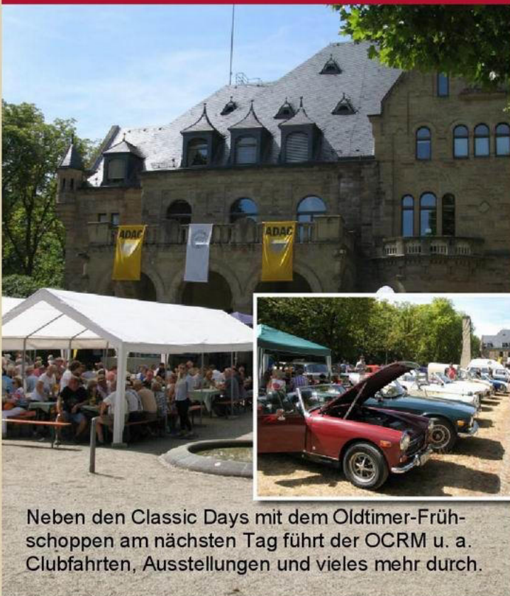
Neben den Classic Days mit dem Oldtimer-Frühschoppen am nächsten Tag führt der OCRM u. a. Clubfahrten, Ausstellungen und vieles mehr durch.

Bei der 25. Internationalen Rhein-Main Oldtimerfahrt lief alles hervorragend. Samstags vor dem Start hatte es noch einmal geregnet. Danach war es trocken und die Cabrios konnten offen fahren. Auch zum neunten Oldtimer-Frühschoppen am Sonntag im Schlosspark Waldthausen, wo über 500 Old- und Youngtimer die zahlreichen Besucher begeisterten, war das Wetter für Teilnehmer und Gäste angenehm.