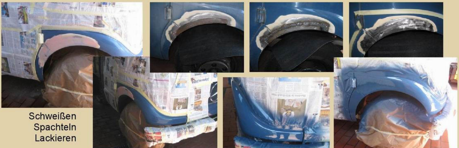
Schweißen Spachteln Lackieren

Er musste mal etwas aufgefrischt werden, wie das so ist wenn man älter wird. An einem Tag im Juni haben sie ein Blech eingeschweißt, gespachtelt und lackiert. Jetzt sieht er wieder aus wie neu.