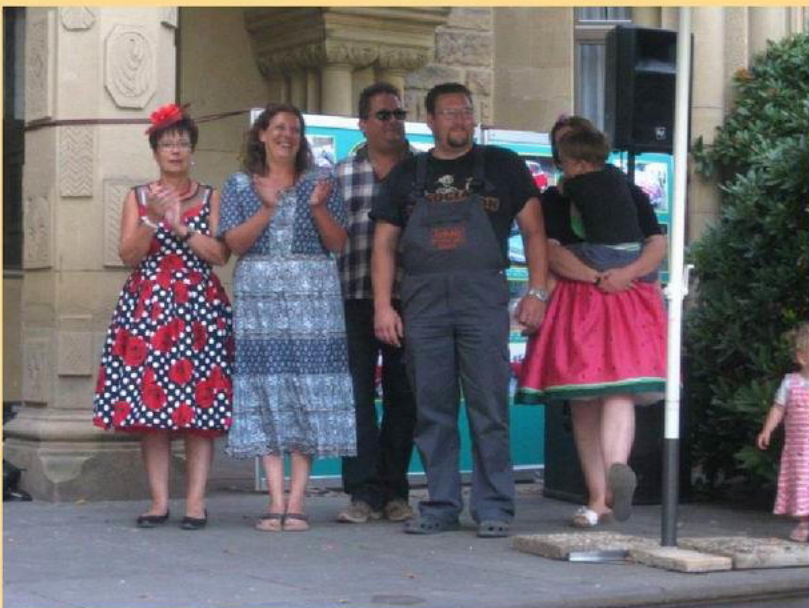
Die Gesamtsieger 2018