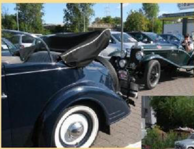
Mittag bei „ClassicBid“ Grolsheim