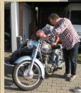
Es gab in diesem Jahr gegrilltes, div. Salate und andere Leckereien