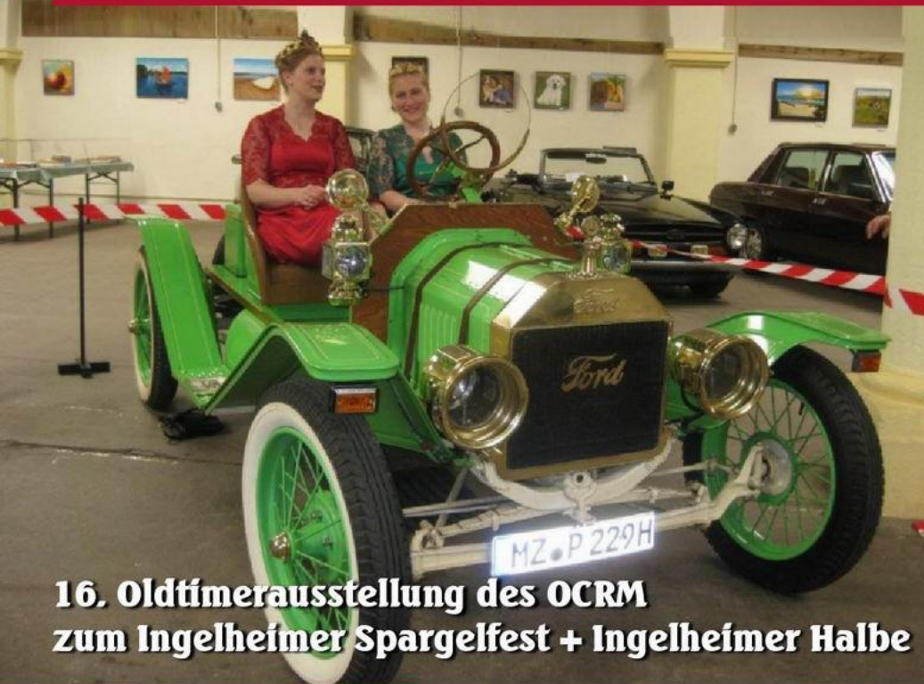
16. Oldtimerausstellung des OCRM zum Ingelheimer Spargelfest + Ingelheimer Halbe