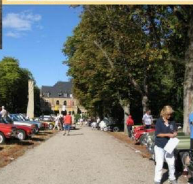
120 Teams am Start